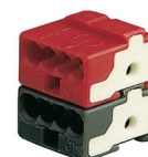
Busklemme til lysstyring.