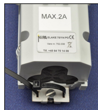
Kabelaflastning i bund med påmonteret specialbeslag og kabelstrip.