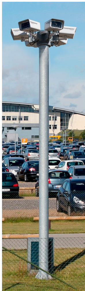
Billund Lufthavn