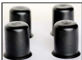
Sorte PVC boltbeskyttere til alle størrelser

Anvendelse af fundamentsbolte og støbeskabeloner fra Nipa.