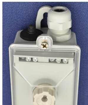
Kabelafkastning i top med PG forskruring.