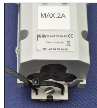
Kabelafkastning i bund med påmonteret specialbeslag og kabelstrip.