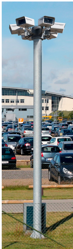
Billund Lufthavn